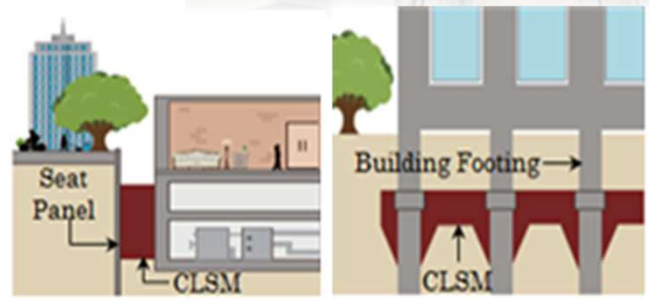
CLSM : Soil, Footing